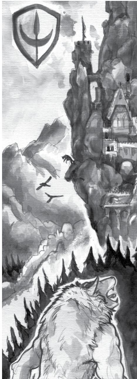
Die Feste Aarenstein

Dieser Ritter versucht nun bei jeder sich bietenden Gelegenheit, Streiter dafür zu gewinnen, den Aarenstein schließlich doch noch zurückzuerobern. Es heißt, in letzter Zeit habe Ritter Irion bei diesem Unterfangen einige Erfolge verzeichnen können. Langsam aber sicher scharf er Ritter und