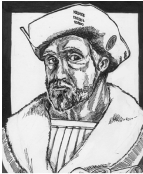
Graf Bunsenhold zur Sichel

Am auffälligsten ist dies: Seit dem Jahr 1037 BF hat sich in vielen Sichler Baronien ein Machtwechsel vollzogen. Teilt man die Lehen in zwei Lager auf – eines, dessen Herrscher dem Grafen gewogen sind, und