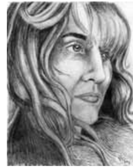
Die „Wilde Hilde“

Nach allem, was unseren Berichterstattern in den vergangenen Monden zugetragen wurde, hat Mirnhilde von Hahnfels den Herrschern von Herzogenthal, Ingerimms Steg und Adlerflug sowie einigen Junkern und Rittern aus altehrwürdigen Familien Darlehen geboten, damit sie ihre Schulden begleichen können. Was zunächst abenteuerlich klingt, ist bei näherer Betrachtung gar