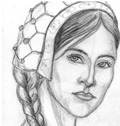
Danje von Binsböckel-Glückshaus

G rafenstadt Salthel, Travia 1040 Bf. Den vielen Schicksalsschlägen zum Trotz, die die Rondrakirche in den vergangenen Monden hinnehmen musste, bleibt sie doch handlungsfähig. So kehrte Hochwürden Alinja Leuenklinge von Norburg, Schwertschwester von Baliho, nicht allein aus Perricum zurück, wo sie den Feierlichkeiten zur Inthronisierung des neuen Schwerts der Schwerter beiwohnte. Vielmehr reiste sie in Gesellschaft eines neuen Vorstehers für den Saltheler Rondratempel. Ritter der Göttin Mamertus Droangrasch von Ferdok soll noch im Winter zum Prätoren geweiht werden. Eigens hierfür wird Ihre Eminenz Aldare VIII. Donnerhall von Donnerbach die Grafenstadt der Sichelwacht besuchen. Im Rahmen eines großen Göttinnendienstes soll vor allem auch der vielen Toten gedacht werden, die Drachen-