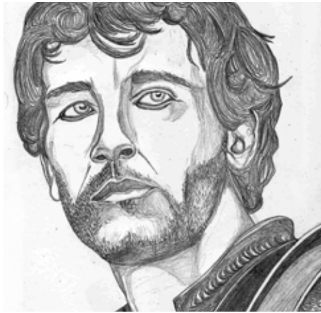
Gamhain von Brachfelde

N ordhag/Balsaith, Baronie Brachfelde, 1039 Bf. Als Dank für das phexfromme Wirken von Baron Gamhain von Brachfelde und seiner Stiefschwester Stinia Haiserus florierte der Handel in Brachfelde seit Herzog Waldemars Zeiten. Die tüchtigen Händler wussten das Markt- und Stapelrecht des Städtchens Balsaith, günstig an der „Alten Straße“ zwischen Trallop und Nordhag gelegen, gut zu nutzen. Doch mussten sie sich immer wieder gegen das einflussreiche Nordhager Handelshaus Tahutin zur Wehr setzen. Insbesondere der alte Ronder Tahutin führte eine erbitterte Fehde gegen den Baron und scheute kein Mittel, den Brachfeldenern zu schaden. Im Gegenzug zögerte auch Baron Gamhain nicht lange, Leudane Emer von Finsterkamm Ende 1033 BF waffenstarke Unterstützung zuzusichern, als Stadtmeister Ralmir Tahutin, Ronders Bruder, den Nordhager Stadtrat gegen die neue Baronin aufwiegelte. Seither eskalierten die Auseinandersetzungen immer weiter; aus unlauteren Geschäftsgebaren der Händler wurden