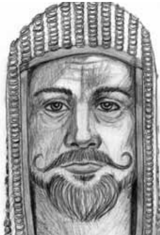
Norgrimm von Fuchsfell

Nun aber hat der herzogliche Vogt die Initiative ergriffen und zuverlässigen Quellen zufolge einen Brautwerber beauftragt, nach einer passenden Frau zu suchen. Dass er die Sache nicht selbst in die Hand nimmt, sehen einige Lästermäuler als Beweis für eine Neigung zu Männern hin, wie sie auch schon seinem Onkel nachgesagt wurde. Andere verweisen darauf, dass Norgrimm sich