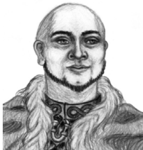
Weldmar von Weissenstein

B aliho/Schwangbühl, Baronie Zippeldinge, Firun 1039 Bf. Ernüchternde Kunde brachte Weldmar von Raufenfels-Weissenstein, Vogt von Gräflich Zippeldinge, nach Burg Räuhsch. Er berichtete seiner Gräfin, wie schlecht es unterdessen um ihr Allod steht. Der im Ronda 1032 BF von vielen Weidener Recken erkämpfte Waffenstillstand hatte einen unerhöht hohen Preis, wie Herr Weldmar befand. Der gebirgige Teil Zippeldinges wurde den Goblins damals in einem verbindlichen Vertrag – gezeichnet von vielen bekannten Weidener Streitern – zugesprochen. Damit wurde den Rotpelzen zwei Drittel der Fläche Zippeldinges überlassen, und zwar ungeachtet im Gebirge liegender Dörfer und Güter. Adelsfamilien sahen sich gezwungen, ihre Lehen aufzugeben und fort zu ziehen, wie die Familie Schrauffenfels, die nun in