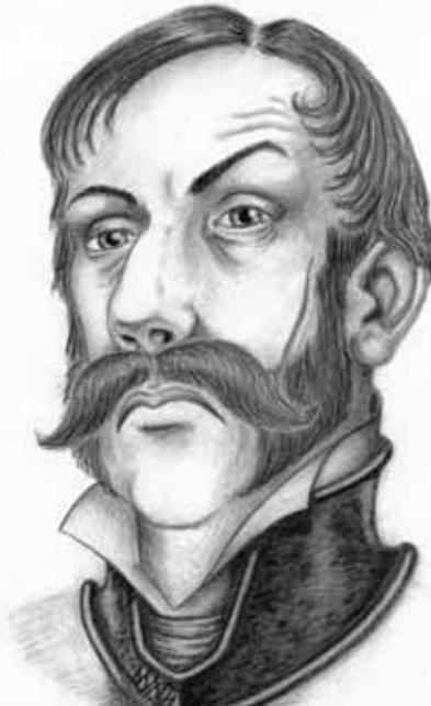
Erzelhardt von Graufenbein

Dies sind die bekannten Fakten: Der einzige Sohn und Erbe Baron Erzelhardts wurde im Herbst 1033 BF bei einem Goblinüberfall auf rauheneckscher Gemarkung verschleppt und getötet (FANTHOLI berichtet). Nach der Tragödie verschlechterte sich das ohnehin zerrüttete Verhältnis zwischen seiner Hochgeborenen und der aufrührerischen Junkersfamilie, der nicht nur der Ruh des Raubrittertums anhaftet, sondern die auch quasi seit Anbeginn der Rotenforster Geschichtsschreibung von einem Anrecht auf den Baronsthron phantasierte. Im Zuge des Haders kamen unter anderem ein Bruder und der Vater des neuen Barons zu Tode. Seit 1035 BF befuhden sich die Familien offiziell, im Ingerimm 1036 BF schließlich kam es zu einem Scharmützel, in